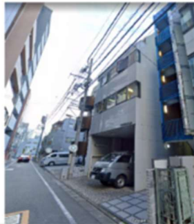
外階段が青色のビル（半地下の駐車場付き）