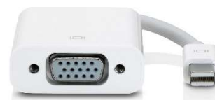
図-2 プロジェクター接続用 ケーブル端子 (Mac 用)