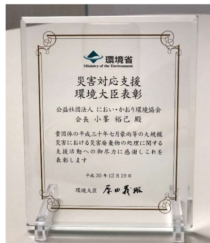
写真2 表彰状と表彰楯