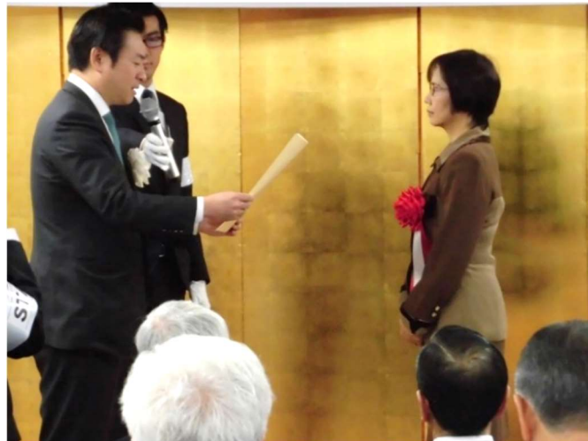
写真1 大臣表彰授与 (左：あきもと司環境副大臣、右：藤倉まなみ副会長)

当協会は平成30年度に災害した自治体への相談窓口設置や、平成30年7月豪雨による災害で広島県坂町において現地調査を行ったことなどが認められ、平成30年12月19日に環境省より大臣表彰を受けました。